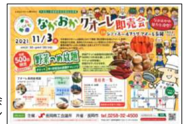
ながおかクオーレ即売会 のPRチラシ