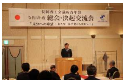
4/20「総会・決起交流会」(青年部)

■「当たり前を磨こう」をテーマに、ビジネス活用にむけたInstagram講座や、女性会メンバーを講師としたワークショップ(美容師によるヘアケア講座)等を通じて相互研鑽に励んだ。会員数35名(45社)