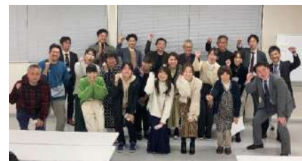
ながおか創業者クラブ

■「若手起業家を巻き込み長岡の起業活性化と継続的な経営のためのネットワークづくりをしよう」をテーマに開催。💡 登録メンバー29名(20名)