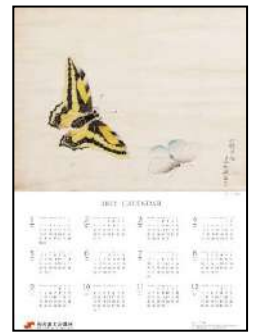
2022カレンダー 山本五十六直筆 の臨画をデザイン

■長岡市からの要請により集団接種の取りまとめを行った。受付期間が短く緊急対応を要するなか、市内企業7社・約280名を取りまとめ、ワクチン接種を支援。