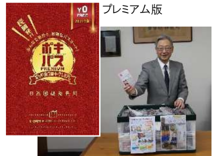
ポキパスのスタンプラリー抽選 応募総数 9,154 枚