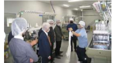
7/15 繊維衣料部会視察会 ミツフジ株式会社福島工場