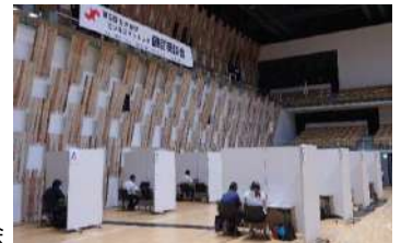
個別商談会 Web 商談の様子

拡充したほか、県外からの移動を伴う商談は延期し 12 月 9 日に振替開催。 エントリー179 社(200 社)、延べ 143 社(うち新規 39 社)、 商談 213 件(うち web 商談 72 件)