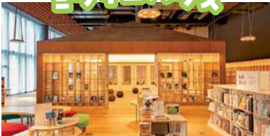
図書館の中に建つ、家の形をした部屋です。