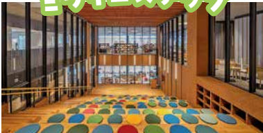
100人収容できる階段状の部屋。講演会に便利です。