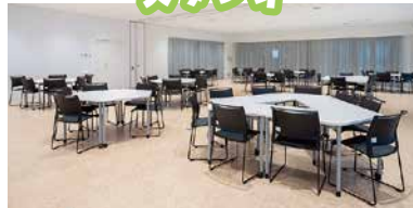
机と椅子を自由に配置できます。半分に仕切って使用することもできます。